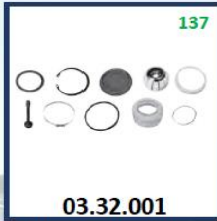
REPARO DE LA "V" (Ø 90 MM)