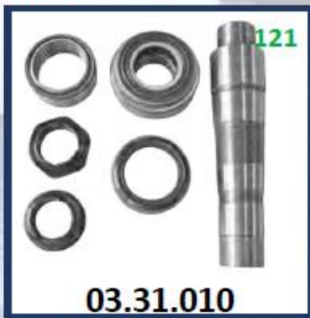
PASADOR PUNTA EJE SIN RODAMIENTO (53MM)