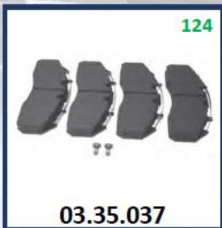
PASTILLA DE FRENO FH12 MODELO 2006 - 2008 (250*107*30)