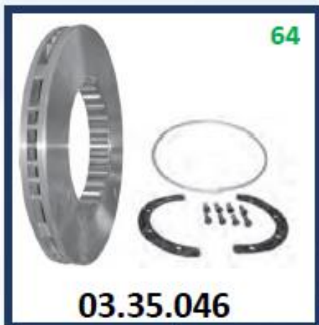
DISCO DE FRENO FH (DIMENSIONES 410 X 45 MM)