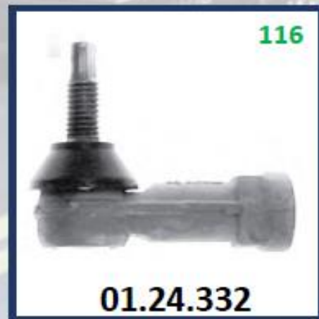
MUÑON BARRILLA CAJA DERECHO