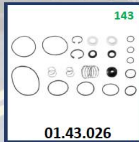
REPARO PEDAL FRENO F12 NORMAL