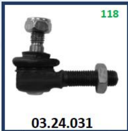
MUÑON BARRILLA CAJA ROSCA EXTERNA