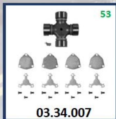
CRUCETA CARDA F7