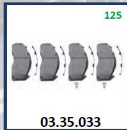
PASTILLA DE FRENO FH12 MODELO HASTA 2005 (249,30*111,20*29)