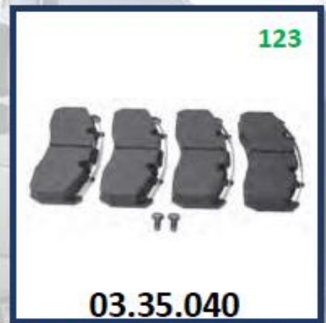
PASTILLA DE FRENO FE/FL240-280 (216*100*29)