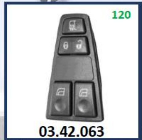
PANEL DE INTERRUPTORES, PUERTA