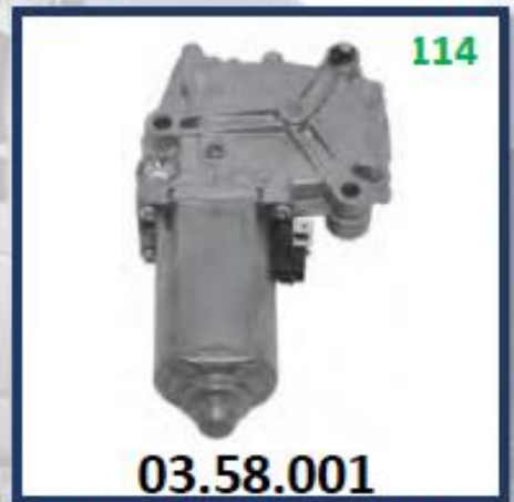
MOTOR ELECTR. LEVANTAVIDRIO ISQUIERDO