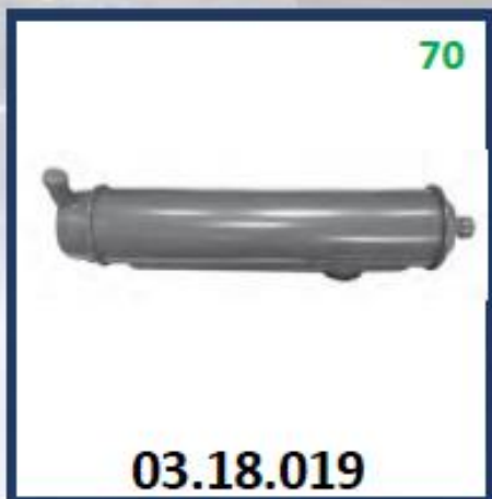
ENFRIADOR ACEITE DE MOTOR TD121