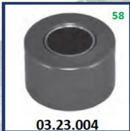
DADO HORQUILLA DE EMBREAGUE (REDONDO)