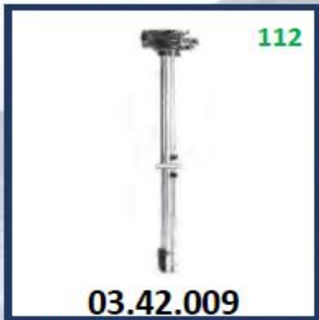
MEDIDOR DIESEL COMPLETO (679MM)