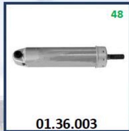
CILINDRO FRENO MOTOR