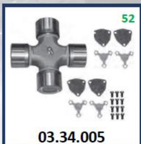
CRUCETA CARDA F10