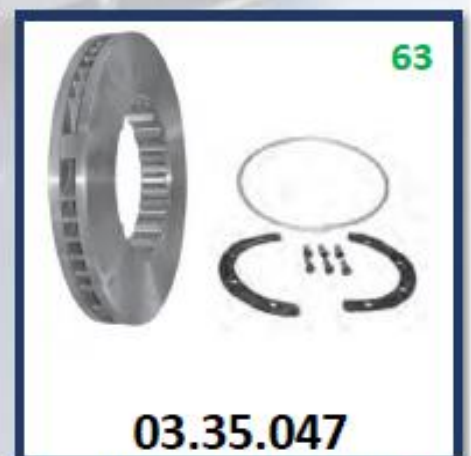
DISCO DE FRENO FH (DIMENSIONES 375 X 45 MM)