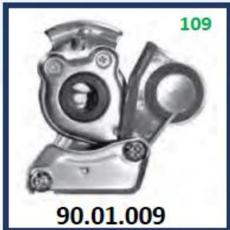
MANO DE AMIGO MECANICO M22X1,5 (ROJO)