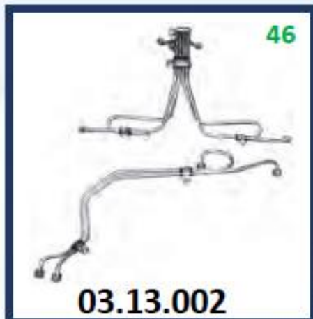
CANERIAS INYECTORES TF101-102