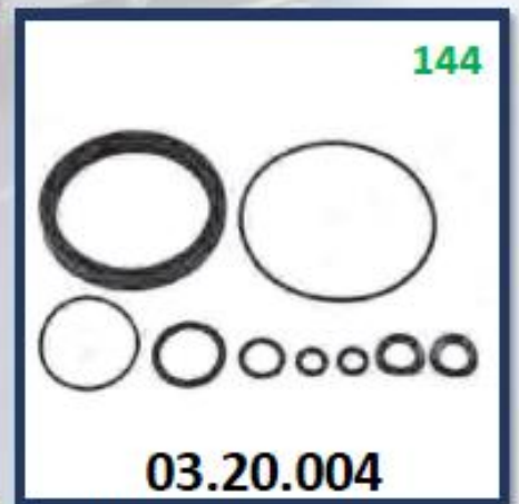
REPARO SELECTOR CAJA R5