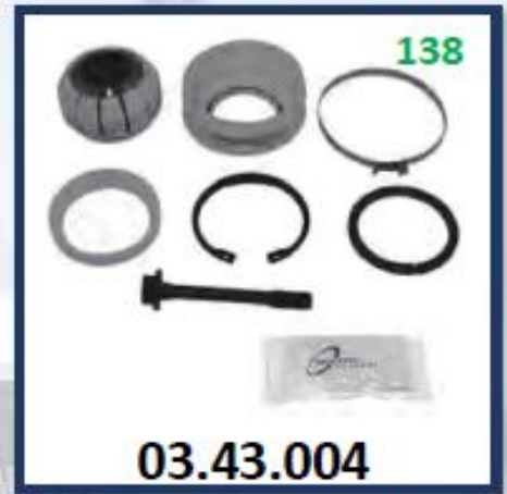
REPARO DE LA "V" (PARA BUJE 03.43.010) (Ø 85 MM)