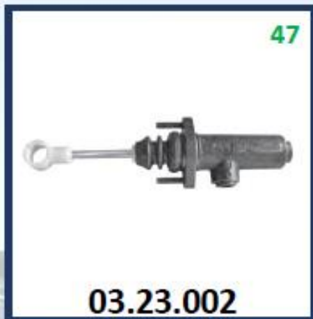
CILINDRO EMBREAGUE FH