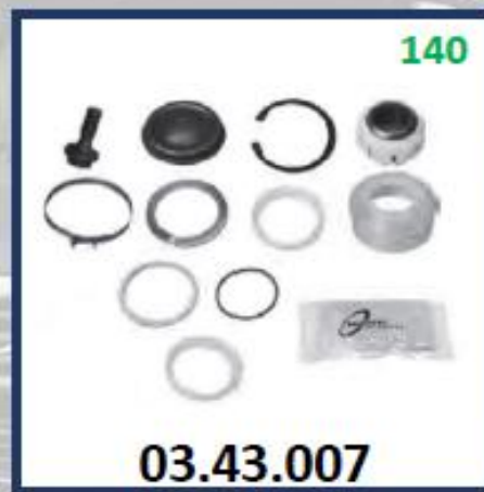
REPARO DE LA "V" PEQUEÑO (70MM DIAMETRO EXTERIOR)