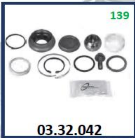
REPARO DE LA "V" PEQUEÑO (70MM DIAMETRO EXTERIOR)