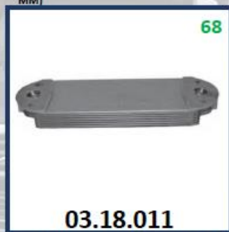
ENFRIADOR ACEITE DE MOTOR FH12 -D12C