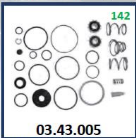
REPARO PEDAL DE FRENO MODERNO FAROL CUADRADO