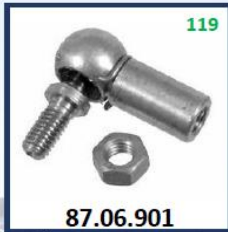
MUÑON DE ACCELERADOR