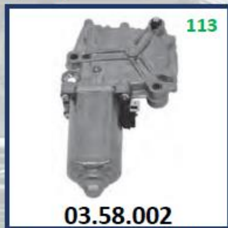
MOTOR ELECTR. LEVANTAVIDRIO DERECHO