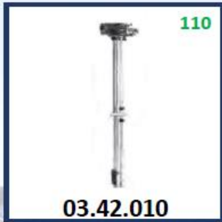
MEDIDOR DIESEL COMPLETO (530MM)