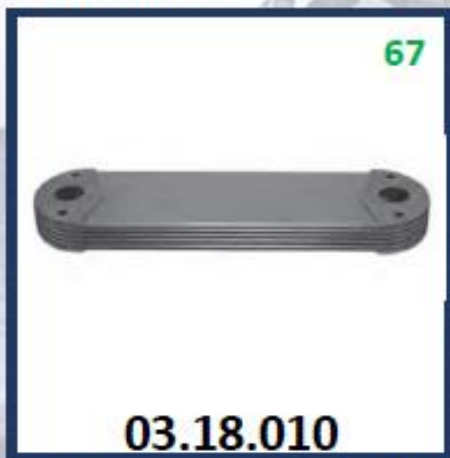
ENFRIADOR ACEITE DE MOTOR FH12 -D12A