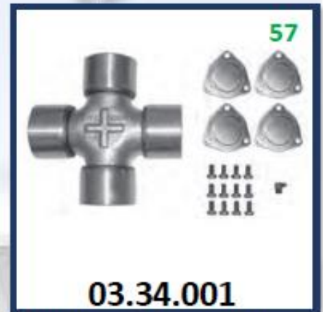
CRUCETA CARDAN F12 C. TAPAS