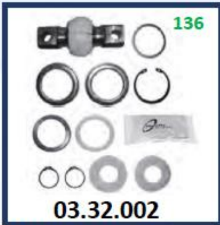
REPARO DE LA "V" (90MM DIAMETRO EXTERIOR)