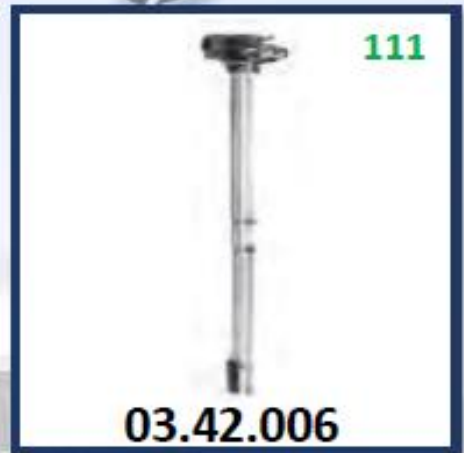
MEDIDOR DIESEL COMPLETO (640MM)