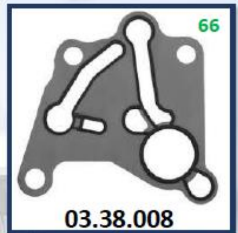
EMPAQUETADURA BOMBA ALIMENTADORA D12A