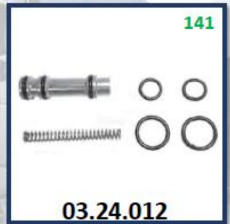
REPARO GALLETAS MODERNO