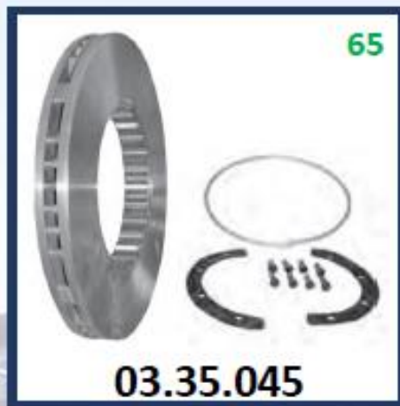
DISCO DE FRENO FH DEL SEGUNDO EJE POSTERIOR (DIMENSIONES 434 X 45 MM)