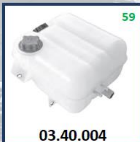
DEPOSITO ANTICONGELANTE/AGUA PARA RADIADOR FH12