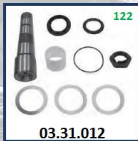
PASADOR PUNTA EJE SIN RODAMIENTO (60MM * 226)