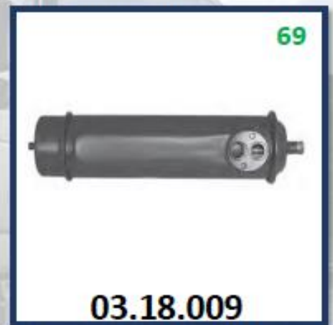
ENFRIADOR ACEITE DE MOTOR TD101