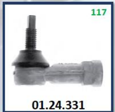
MUÑON BARRILLA CAJA IZQUIERDO