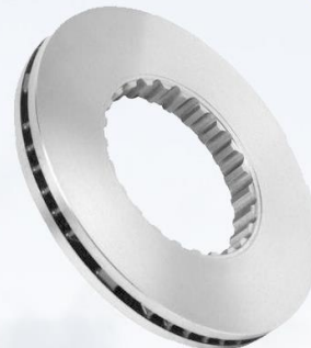
DISCO DE FRENO FH