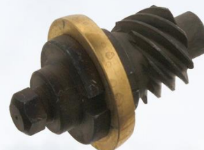
REGULADOR DE FRENO DERECHO