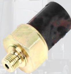
BULBO INTERRUPTOR LUZ DE FRENO F10/F12