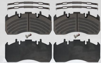
PASTILLA DE FRENO FE/FL240-280