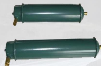
ENFRIADOR ACEITE DE MOTOR TD101