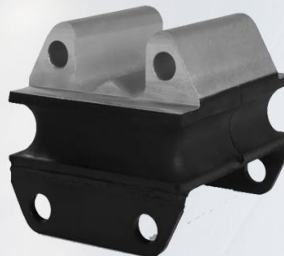
SOPORTE DE MOTOR DELANTERO