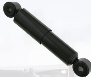
AMORTIGUADOR CABINA DELANTERO