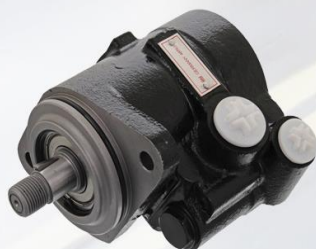
BOMBA HIDRAULICA 135 BARES