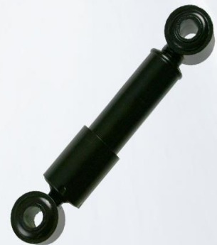
AMORTIGUADOR CABINA FH12 TRASERO. OREJA GRANDE