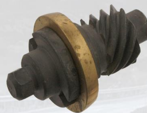
REGULADOR DE FRENO IZQUIERDO