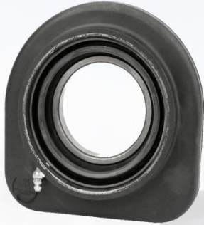
RODAMIENTO CENTRAL INTERCOOLER 70MM