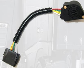
SENSOR PEDAL DE ACCELERADOR CON CABLE DE 5 PINES