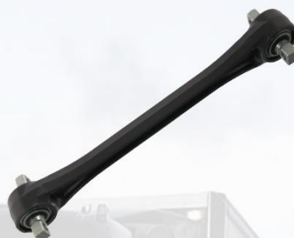
PUNTAL DE EJE