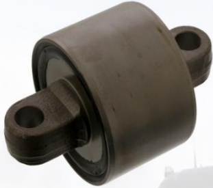
BUJE BARRA OSCILANTE