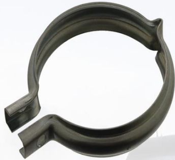
ABRAZADERA ESCAPE FH12/FL6