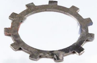
SEGURO RUEDA TRASERA