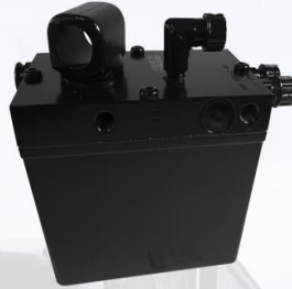
GATA CABINA UNIVERSAL