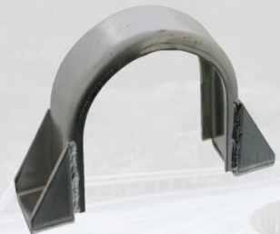
SOPORTE RODAMIENTO CENTRAL