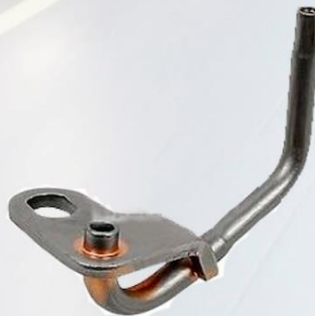
CHISGUETEADOR DE ACEITE D9