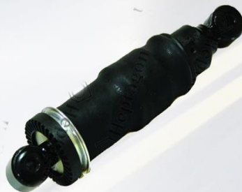
AMORTIGUADOR CABINA TRASERO CON AIRE