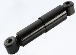
AMORTIGUADOR CABINA F12