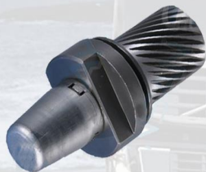
REGULADOR DE FRENO GRANDE DERECHO