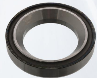
PISTA RUEDA TRASERA A PALIER