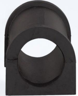
BUJE SOPORTE BARRA ESTABILIZADOR