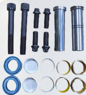
REPARO MORDAZA DE FRENO