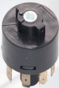
CHAPA INTERREPTUR DE ARRANQUE F10/F12