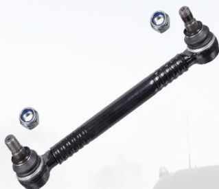
BARRA ESTABILIZADOR FH12/13