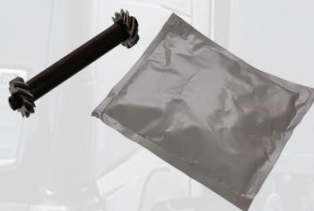
EJE REGULADOR DE FRENO