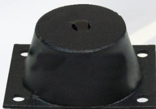
SOPORTE CAJA 6TA