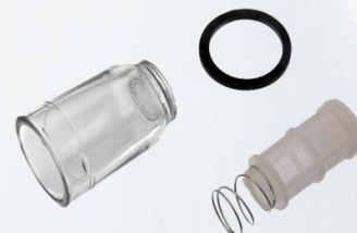
REPARO TRAMPERA DIESEL COPITA