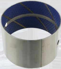
BUJE TRUCKY METALICO