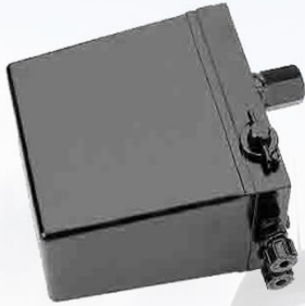
GATA CABINA FH12