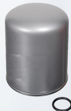
FILTRO DEL DISPARADOR DE AIRE CON SEPARADOR DE ACEITE