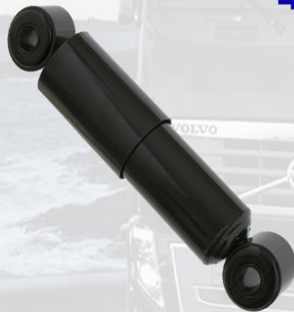
AMORTIGUADOR CABINA NORMAL