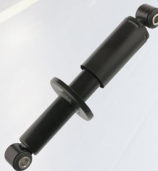
AMORTIGUADOR CABINA TRASERO CON PLATO PEQUEÑO