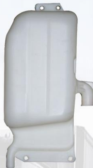
DEPOSITO AGUA F10/F12/F16