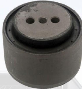
BUJE CENTRAL DE LA V F10/F12