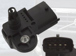
SENSOR DE PRESION DE MULTIPLE ADMISION