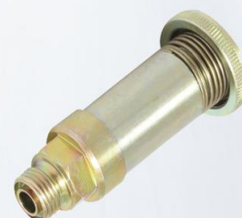
BOMBIN CON RESORTE