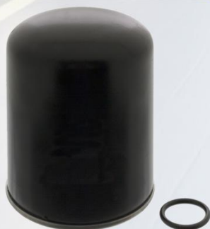
FILTRO DEL DISPARADOR DE AIRE