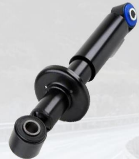
AMORTIGUADOR CABINA F12 DELANTERO CON PLATO