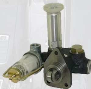
BOMBA ALIMENTADORA COMPLETA CON RODILLO CON COPITA