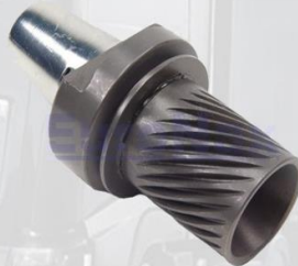
REGULADOR DE FRENO GRANDE IZQUIERDO