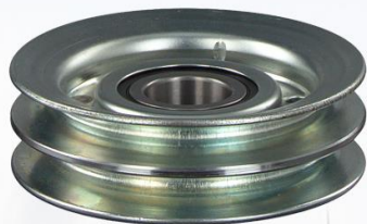
POLEA TESADOR CORREA F10/12