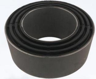
GOBA DE TRUCKY FL6