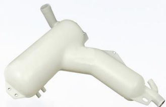
DEPOSITO AGUA F10/F12/F16