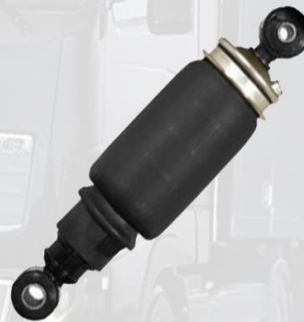
AMORTIGUADOR CABINA F12 DELANTERO CON AIRE