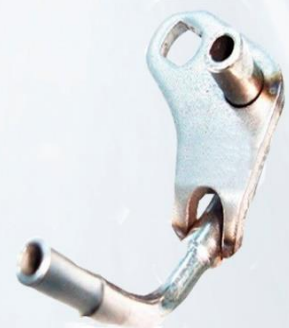
CHISGUETEADOR DE ACEITE FH12