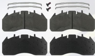
PASTILLA DE FRENO FH12