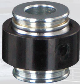
KIT REPARO HORQUILLA EMBREGUE FH