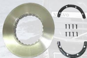
DISCO DE FRENO FH DELANTERO SEGUNDO EJE POSTERIOR (