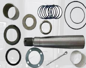
PASADOR PUNTA EJE SIN RODAMIENTO (48MM)