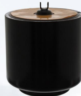
BASE DE GLOBO