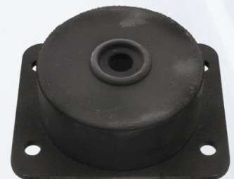
SOPORTE MOTOR DELANTERO ARRIBA