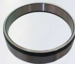
PISTA CUBO CARRETA