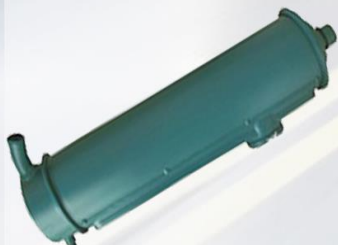
ENFRIADOR ACEITE DE MOTOR TD121