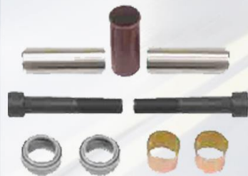
REPARO MORDAZA DE FRENO