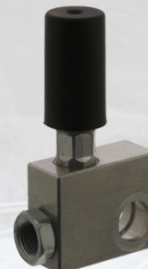
BOMBA ALIMENTADORA FH12