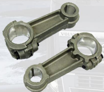
BIELA COMPRESORA WABCO