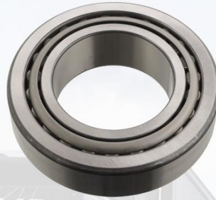
RODAMIENTO RUEDA TRASERA PALIER EXTERIOR